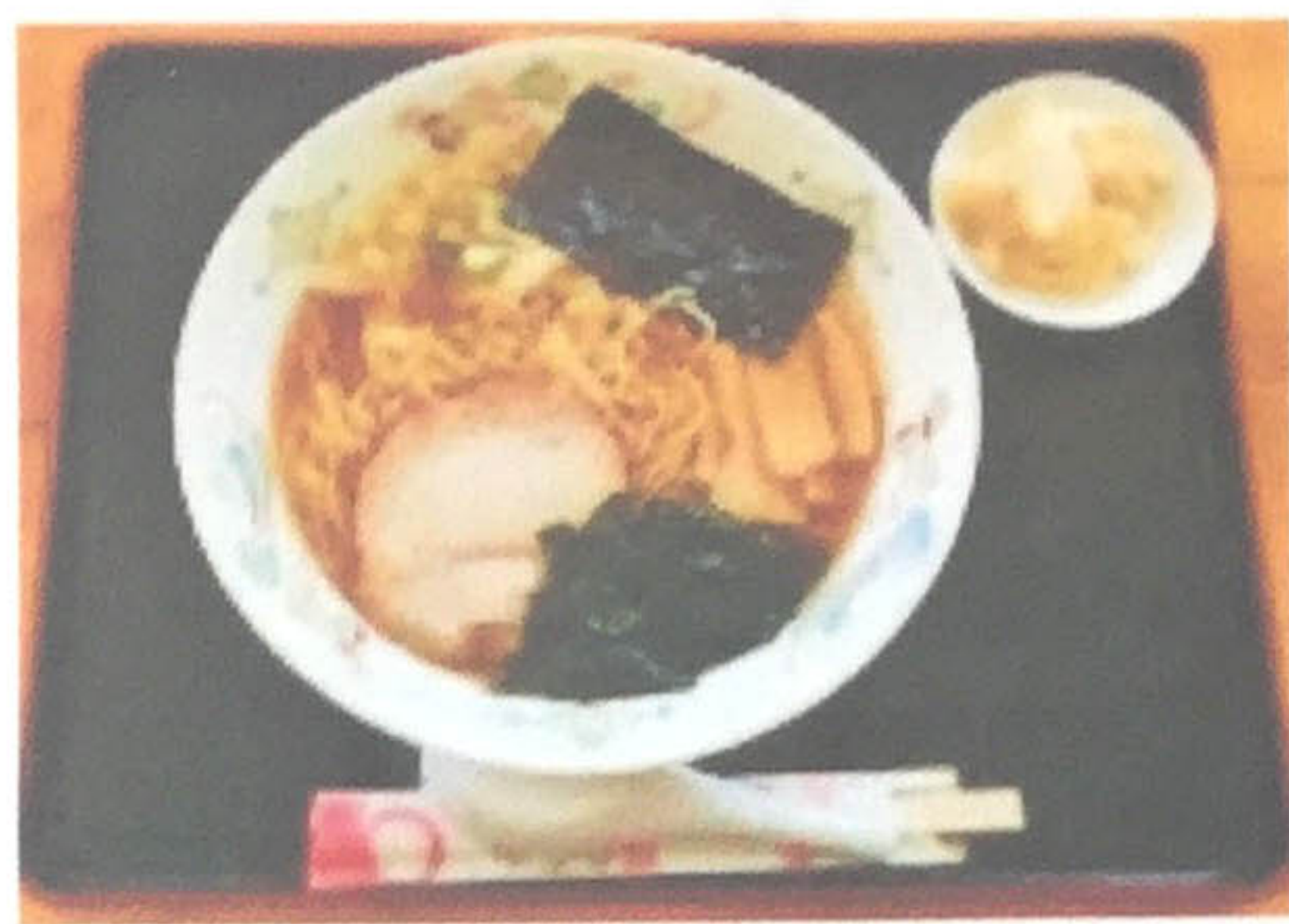
醤油ラーメン 500円 (ラーメン各種大盛り+100円)