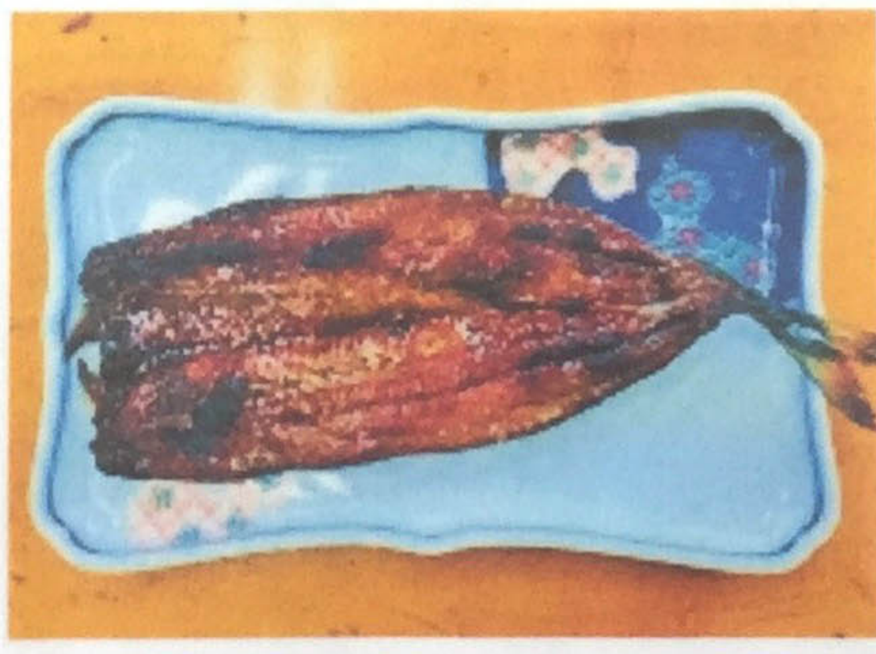
自家製サンマみりん干し(単品) 200円