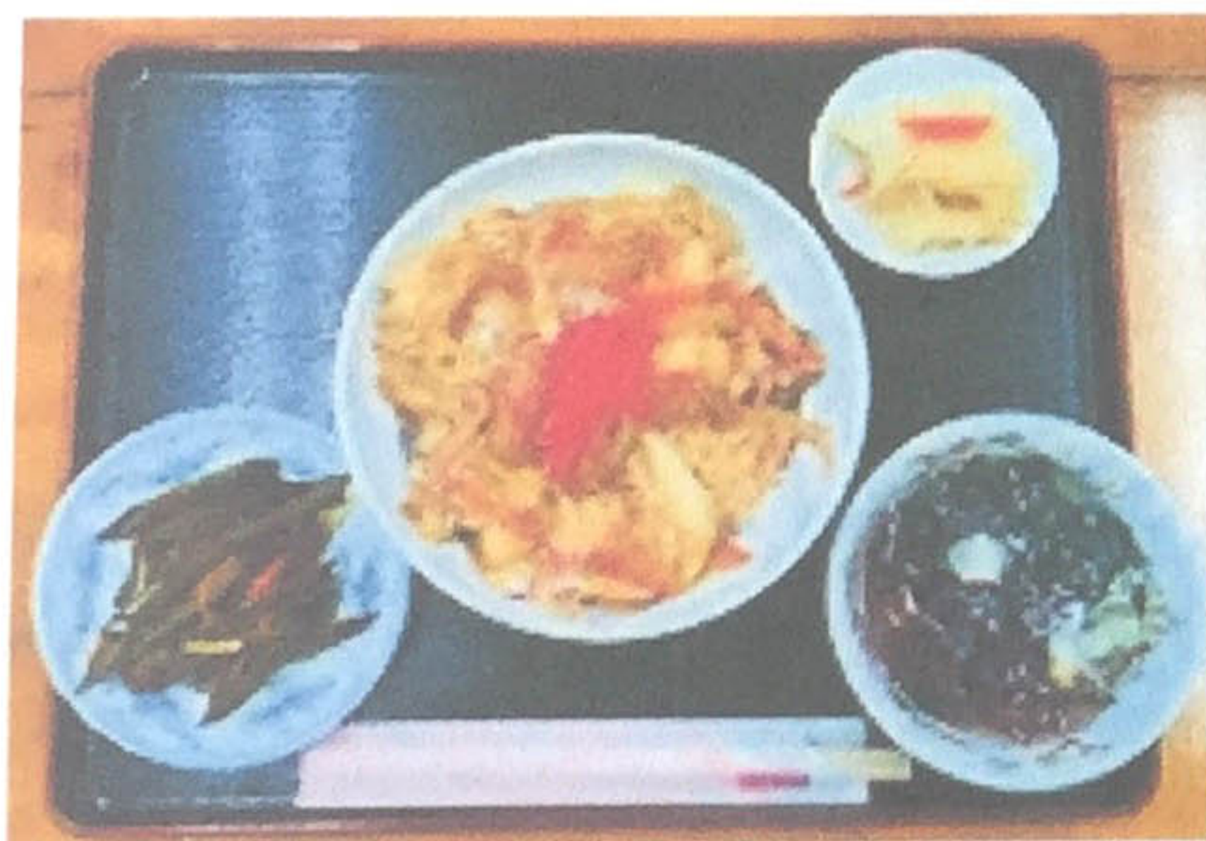
親子丼 600円 (小鉢、スープ付)