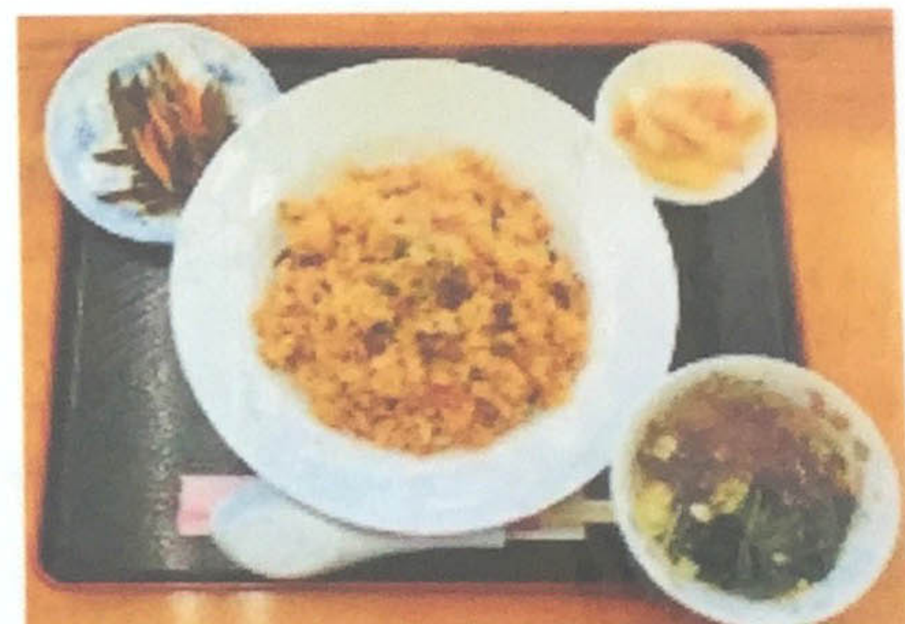
炒飯 600円 (小鉢、スープ付)