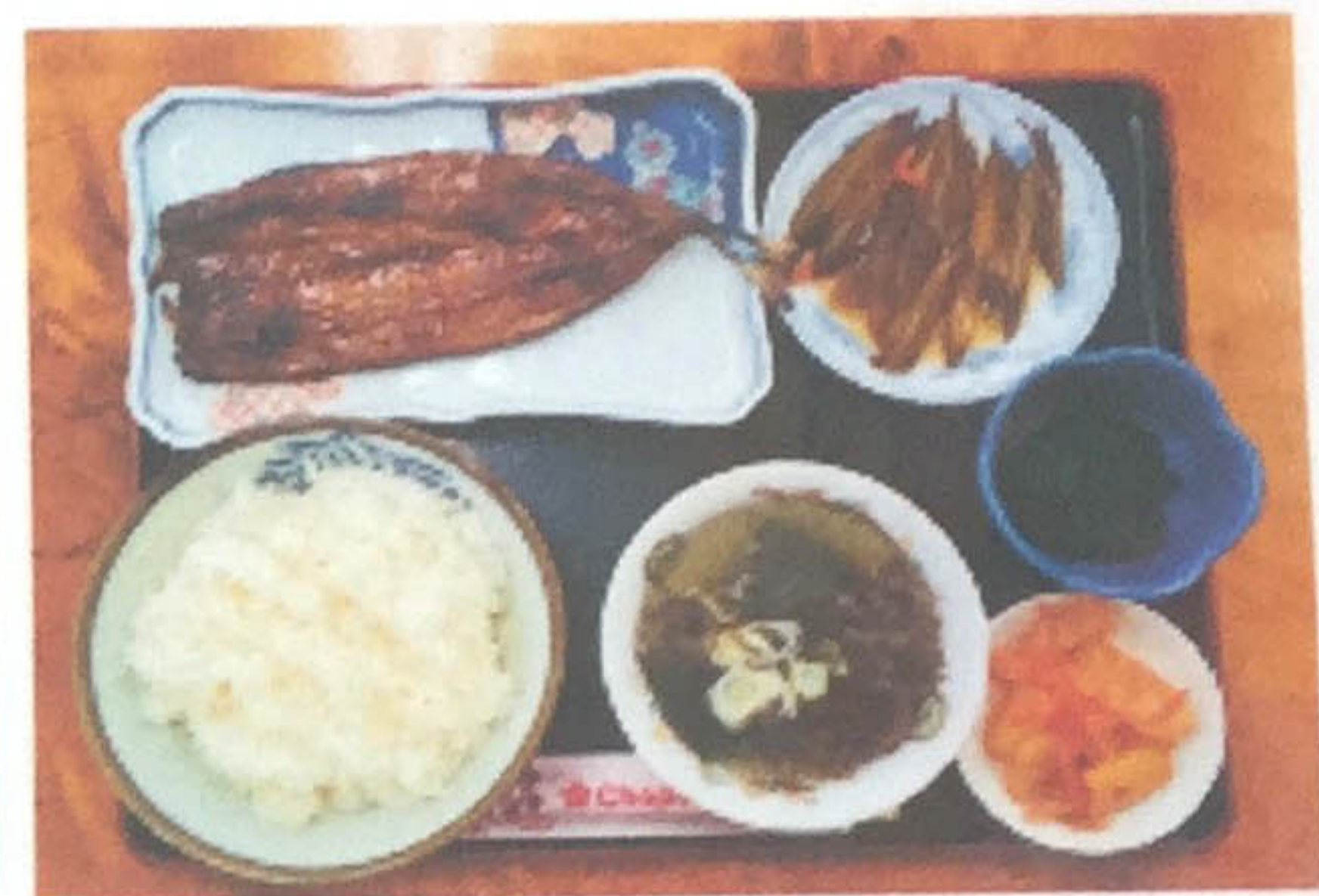
自家製サンマみりん干し定食 600円 (小鉢、スープ付)