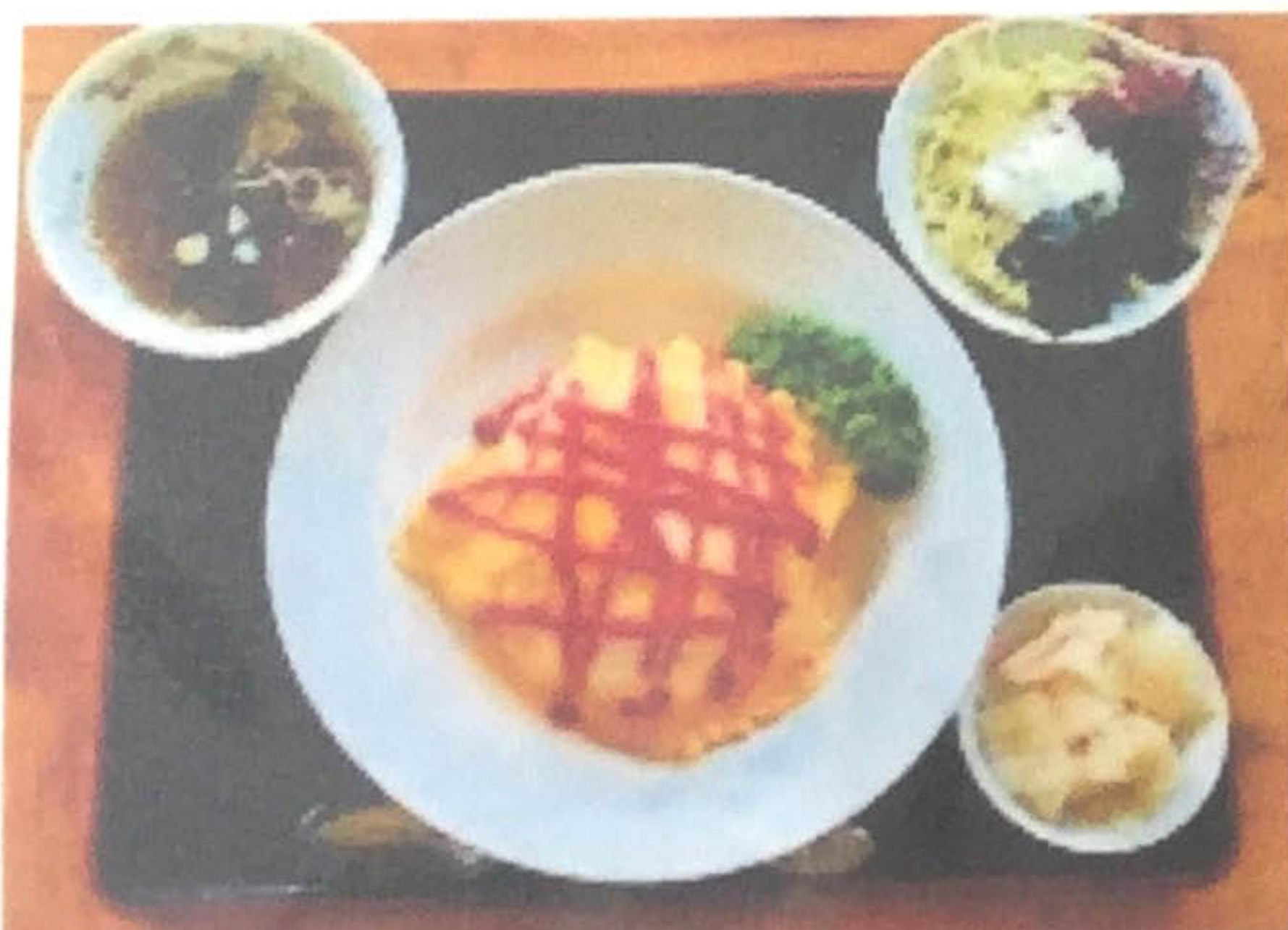
オムライス 600円 (サラダ、スープ付)