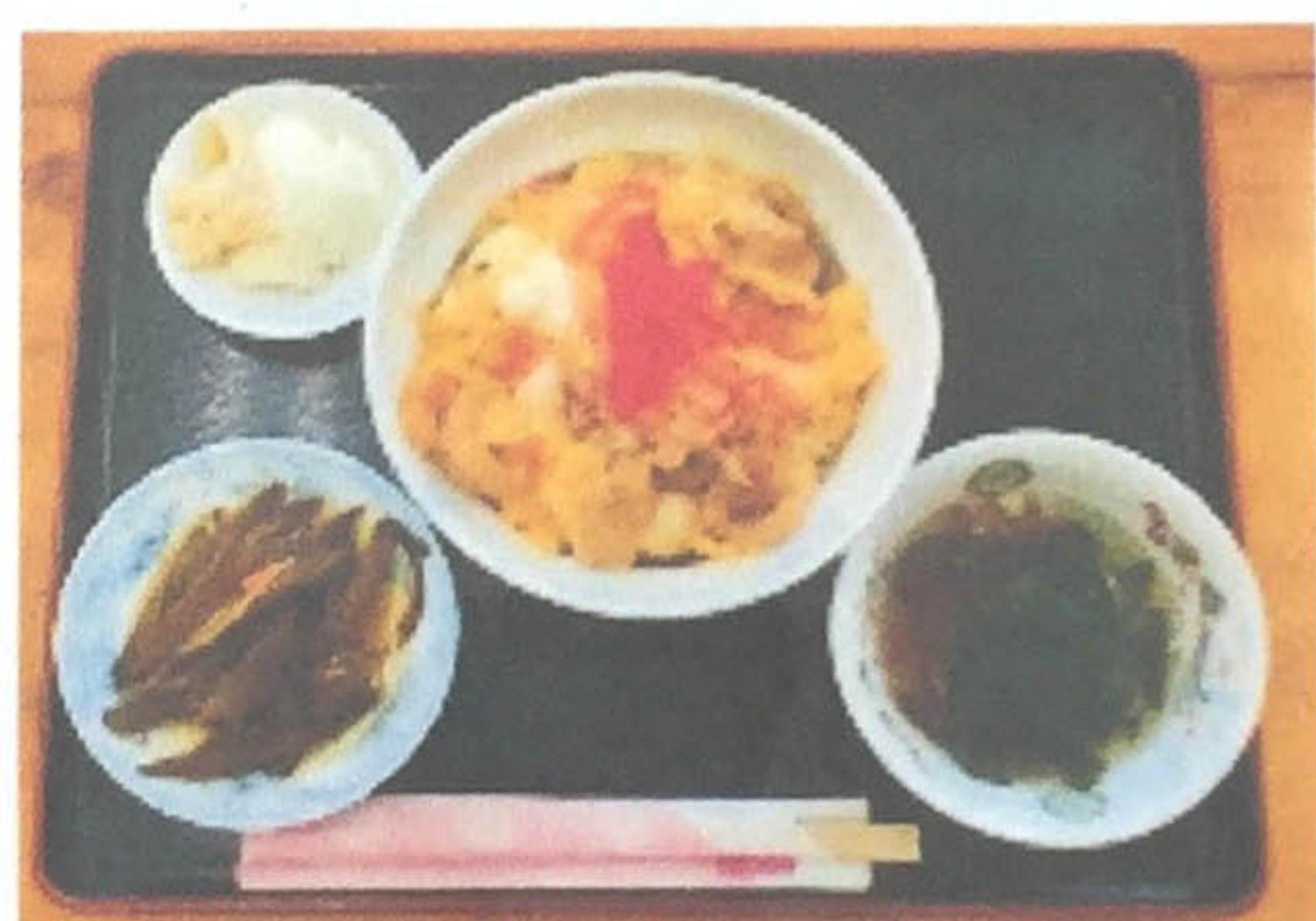
ほたて丼 700円 (小鉢、スープ付)