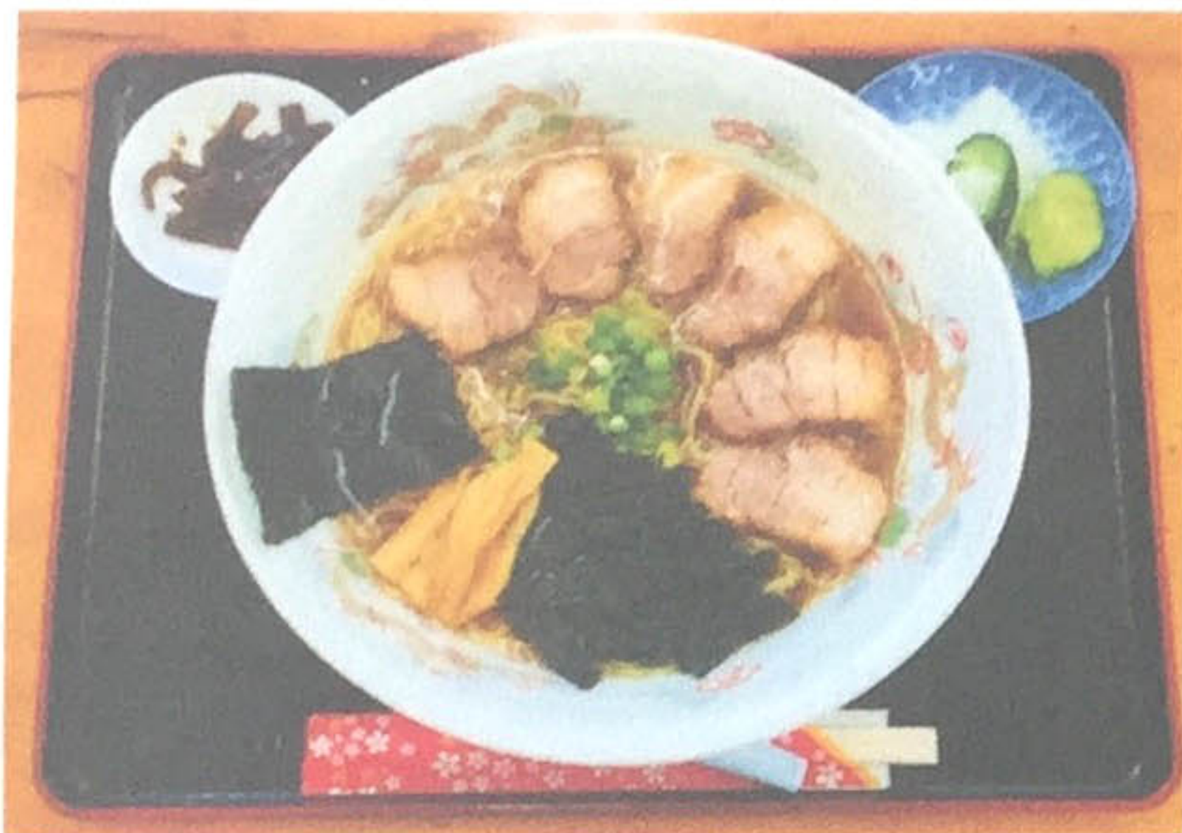
チャーシュー麺 700円