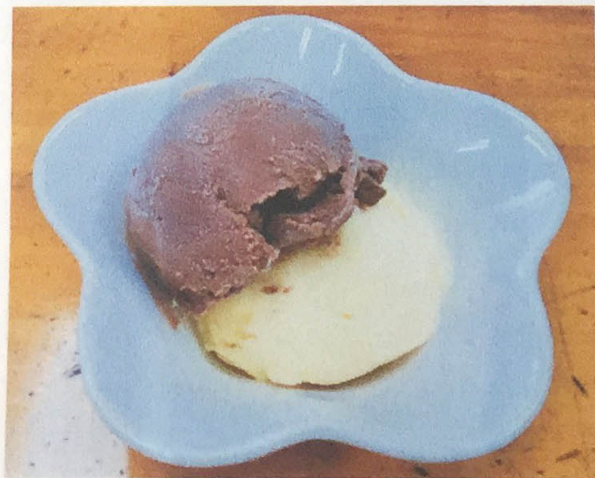
アイスクリーム 300円