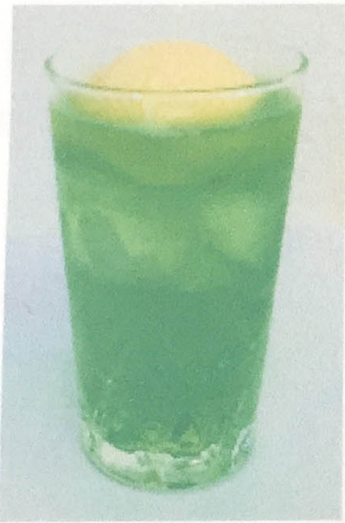
クリームリーダ 400円